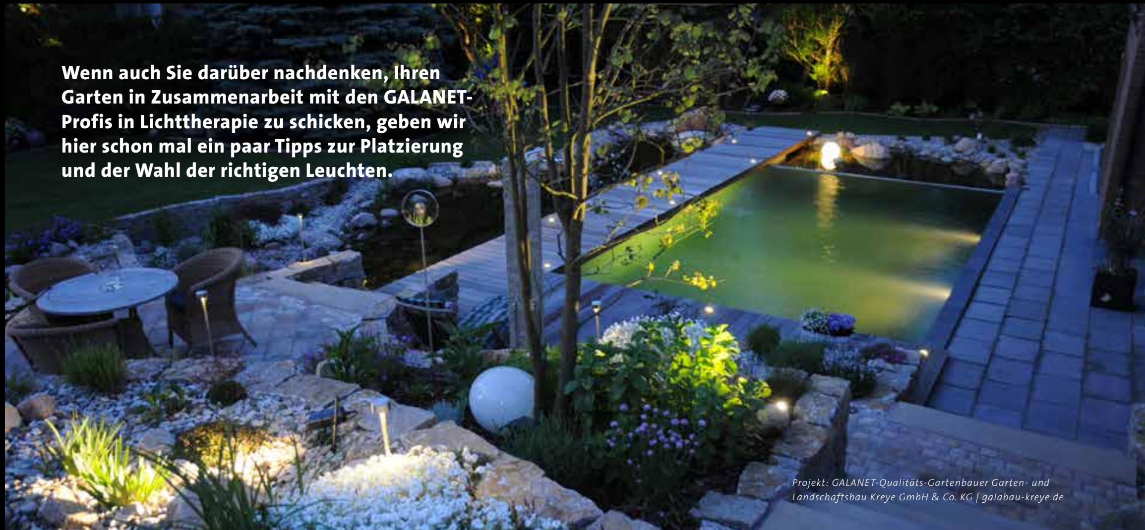
Projekt: GALANET-Qualitäts-Gartenbauer Garten- und Landschaftsbau Kreye GmbH & Co. KG | galabau-kreye.de

Wenn auch Sie darüber nachdenken, Ihren Garten in Zusammenarbeit mit den GALANET-Profis in Lichttherapie zu schicken, geben wir hier schon mal ein paar Tipps zur Platzierung und der Wahl der richtigen Leuchten.