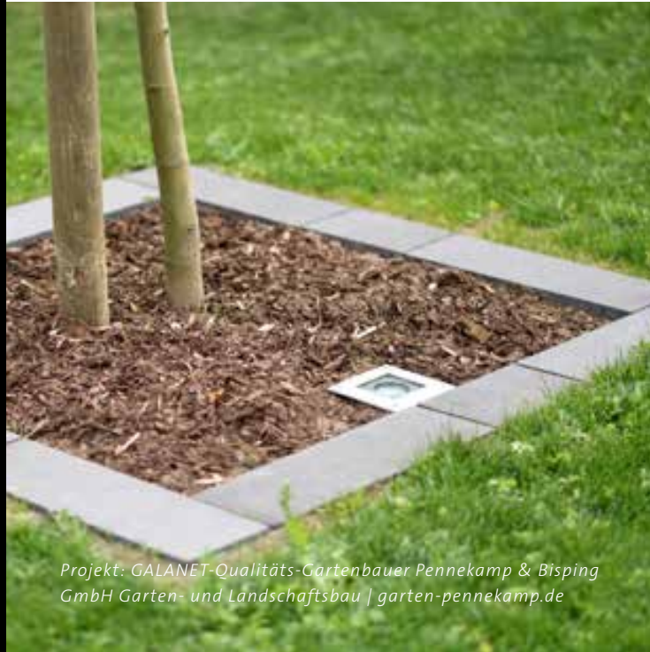
Projekt: GALANET-Qualitäts-Gartenbauer Pennekamp & Bisping GmbH Garten- und Landschaftsbau | garten-pennekamp.de

Das Set ist Ihr Garten, Pflanzen und Skulpturen haben die Hauptrolle übernommen. Um einzelne Elemente Ihres Außenbereiches filmreif in Szene zu setzen, eignen sich Spots am besten. In Bodennähe installiert, bringen Sie Kunstobjekte, elegant gewachsene Baumstämme und voluminöse Büsche im Dunkeln groß raus.