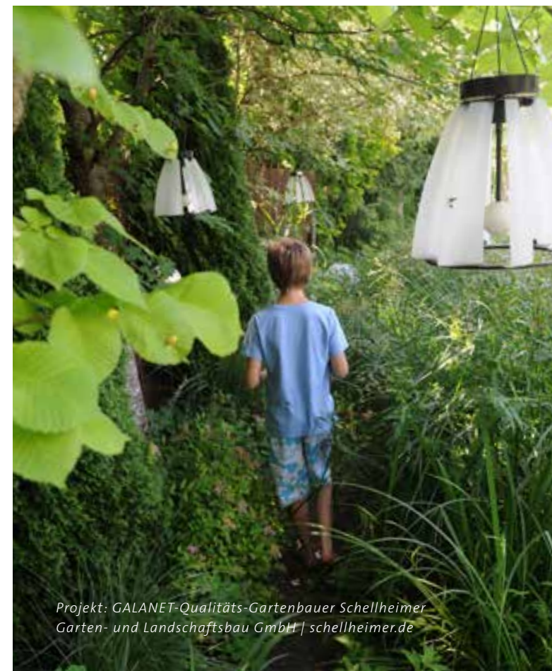
Projekt: GALANET-Qualitäts-Gartenbauer Schellheimer Garten- und Landschaftsbau GmbH | schellheimer.de