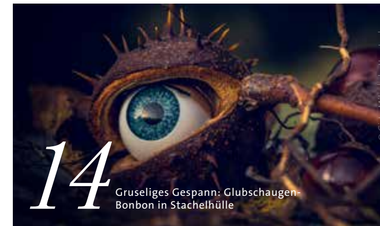
14 Gruseliges Gespann: Glubschaugen-Bonbon in Stachelhülle