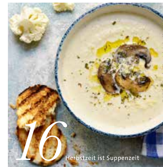
16 Herbstzeit ist Suppenzeit

Redaktion & Layout: FFI Agentur | ffiagentur.de ingruen@ffiagentur.de