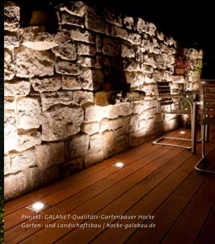
Projekt: GALANET-Qualitäts-Gartenbauer Hocke Garten- und Landschaftsbau | hocke-galabau.de