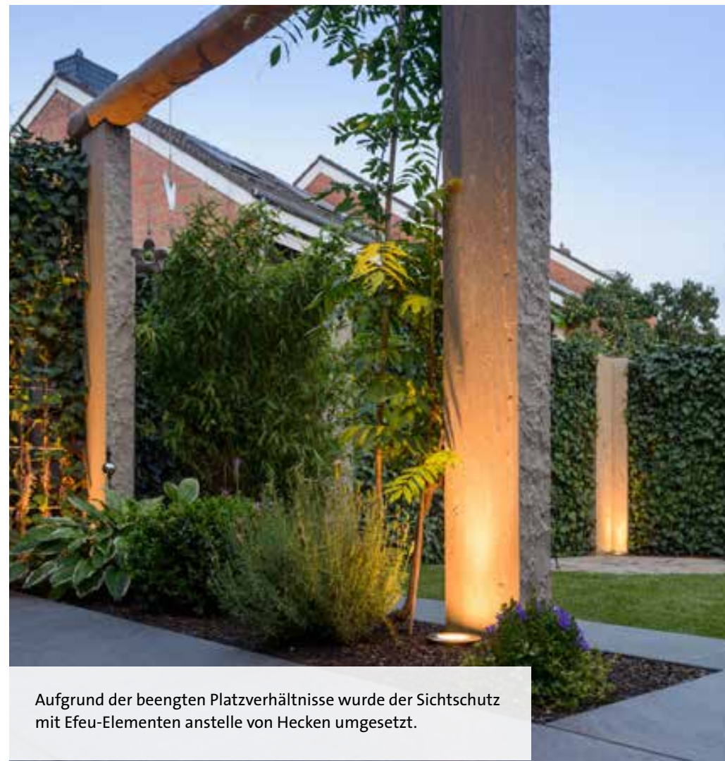
Aufgrund der beengten Platzverhältnisse wurde der Sichtschutz mit Efeu-Elementen anstelle von Hecken umgesetzt.

Falko Werner Garten- und Landschaftsbau GALANET-Partner seit 2005