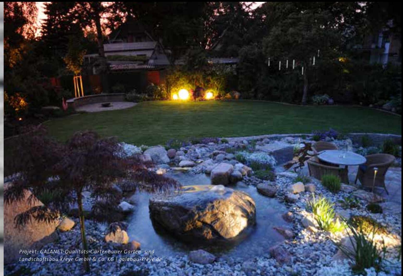
Projekt: GALANET-Qualitäts-Gartenbauer Garten- und Landschaftsbau Kreye GmbH & Co. KG | galabau-kreye.de