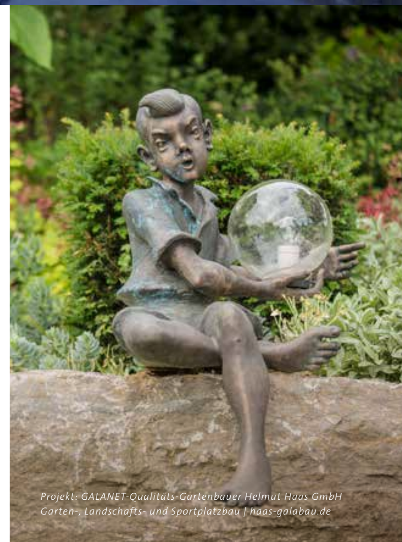
Projekt: GALANET-Qualitäts-Gartenbauer Helmut Haas GmbH Garten-, Landschafts- und Sportplatzbau | haas-galabau.de

Um Ihren Garten auch nach Einbruch der Dunkelheit weiter strahlen zu lassen, muss nicht die gesamte Fläche beleuchtet werden. Perfekt geplant und fachmännisch umgesetzt, tanzen Licht und Schatten leichtfüßig über Grünflächen, Blumenbeete, Terrassen und Wasseroberflächen.