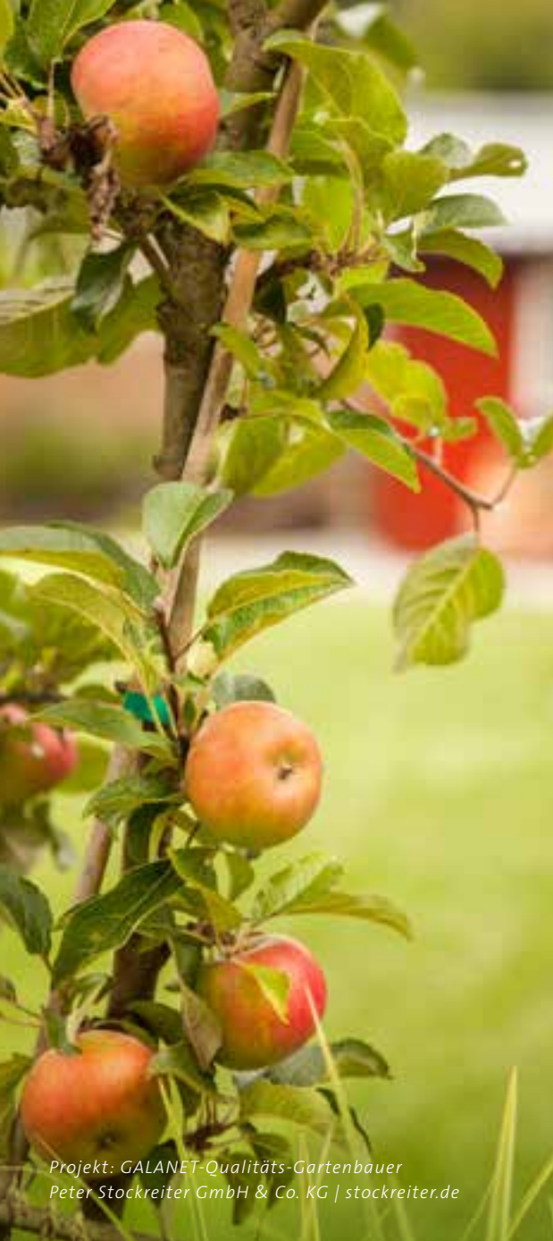
Projekt: GALANET-Qualitäts-Gartenbauer Peter Stockreiter GmbH & Co. KG | stockreiter.de