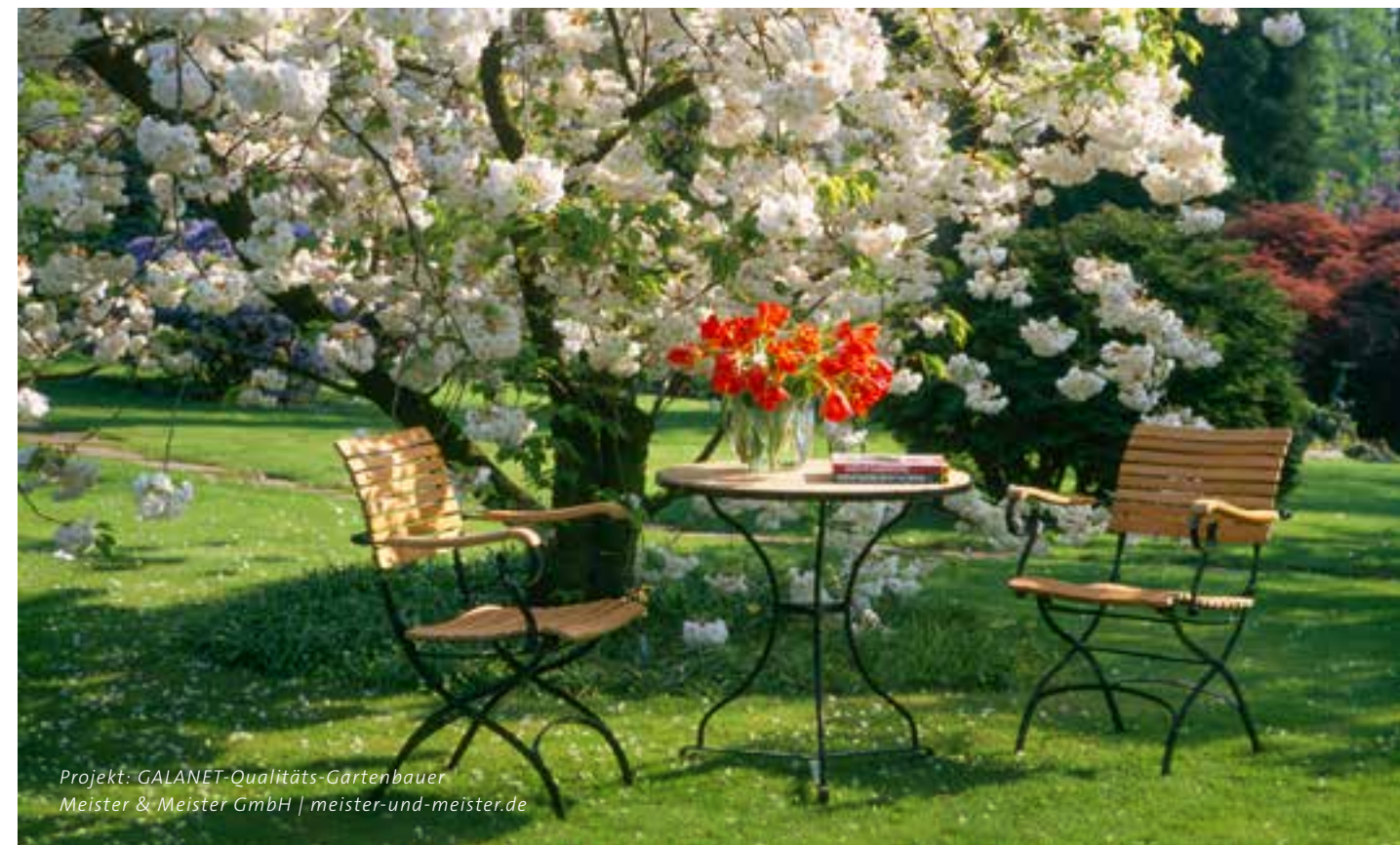
Projekt: GALANET-Qualitäts-Gartenbauer Meister & Meister GmbH | meister-und-meister.de