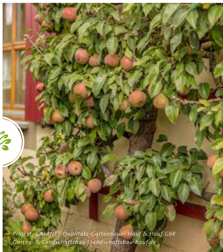
Projekt: GALANET-Qualitäts-Gartenbauer Hauf & Hauf GbR Garten- & Landschaftsbau | landschaftsbau-hauf.de