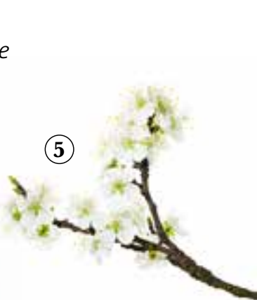
1) Birnenblüte, 2) Kirschblüte, 3) Apfelblüte, 4) Pflaumenblüte, 5) Mirabellenblüte