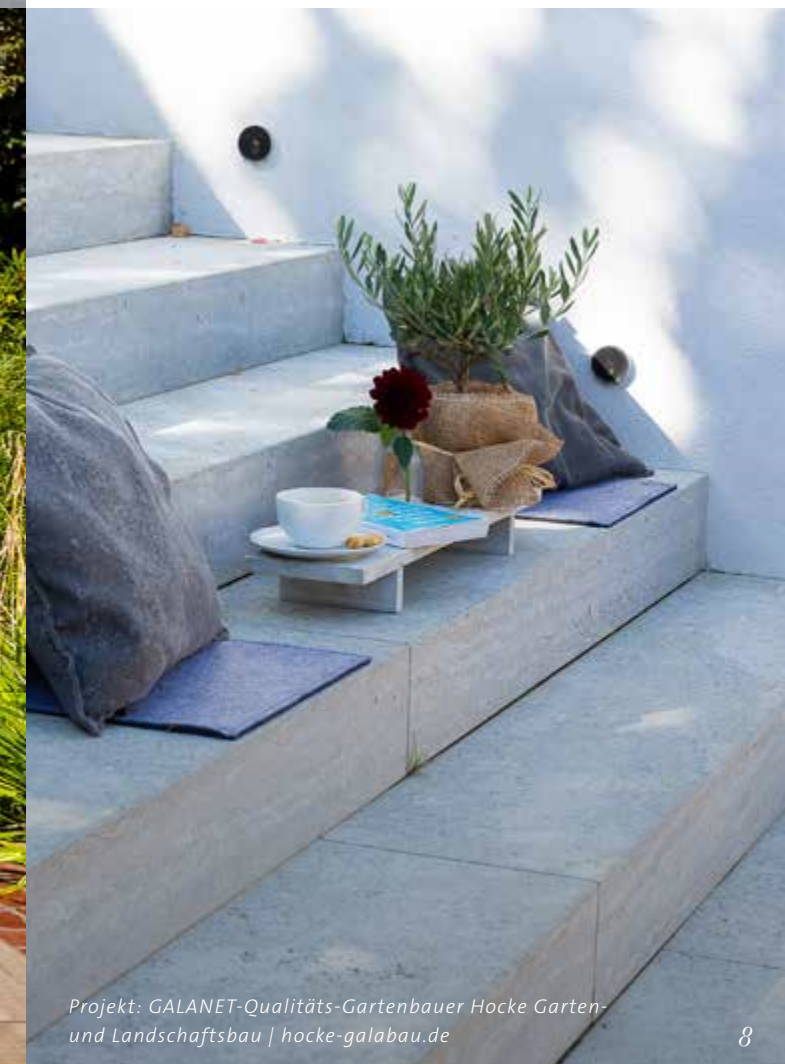
Projekt: GALANET-Qualitäts-Gartenbauer Hocke Garten- und Landschaftsbau | hocke-galabau.de