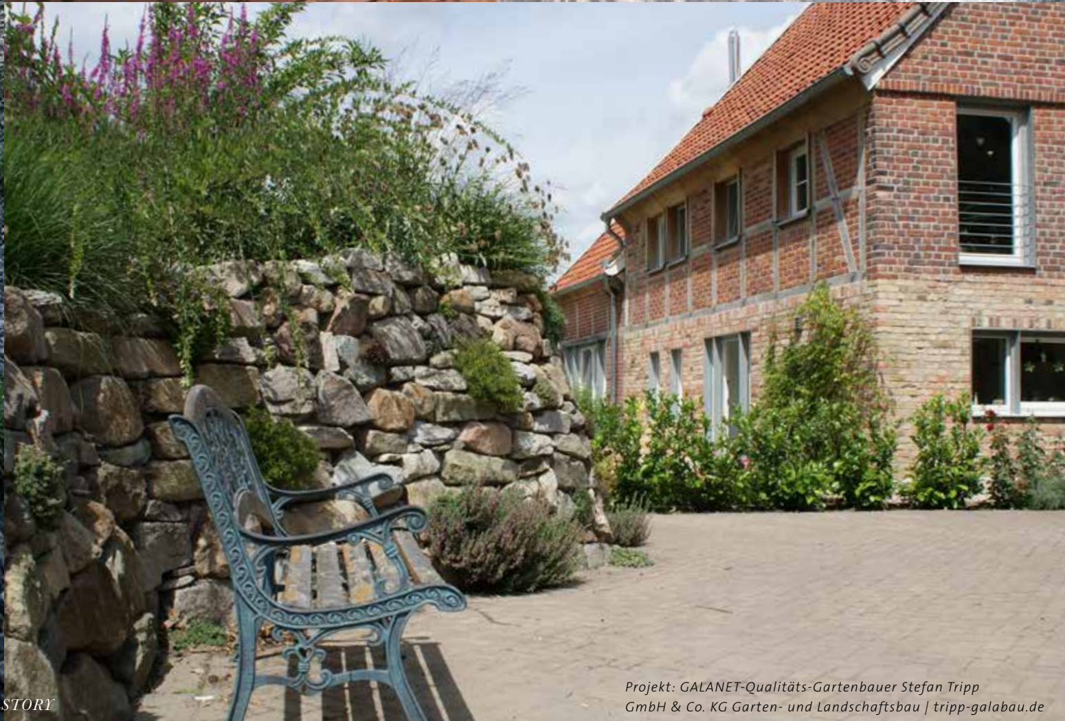
Projekt: GALANET-Qualitäts-Gartenbauer Stefan Tripp GmbH & Co. KG Garten- und Landschaftsbau | tripp-galabau.de