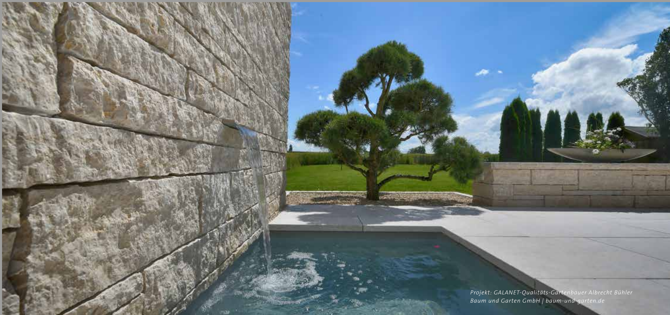
Projekt: GALANET-Qualitäts-Gartenbauer Albrecht Bühler Baum und Garten GmbH | baum-und-garten.de

Eine weitere Verwendungsmöglichkeit für Steine im Garten sind Mauern. Häufig dienen sie als Begrenzungen, die vor störenden Geräuschen und Blicken von der Straße schützen, können aber auch innerhalb des Gartens verschiedene Bereiche voneinander abtrennen und in unterschiedliche Höhen terrassieren. Von Gabionen oder niedrigen Mauern umrandete Hochbeete bringen Obst- und Gemüsepflanzen oder blühende Rabatten auf Augenhöhe. Sehr beliebt sind auch Trockenmauern, bei denen Zwischenräume frei bleiben, anstatt mit Mörtel aufgefüllt zu werden. Hier finden Eidechsen und andere Gartenbewohner Unterschlupf.