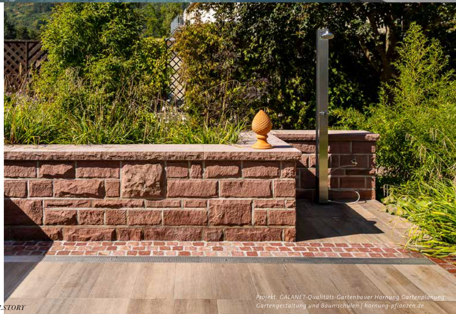
Projekt: GALANET-Qualitäts-Gartenbauer Hornung Gartenplanung, Gartengestaltung und Baumschulen | hornung-pflanzen.de

Ob man Beton- oder Naturstein verwendet, ist letztlich jedem selbst überlassen. Klassischerweise wird die Terrasse eher mit Natursteinplatten gebaut und funktionelle Flächen wie eine Garageneinfahrt mit Betonstein gepflastert. Beide Materialien können auch miteinander kombiniert werden – zum Beispiel, wenn in einem Weg aus Betonsteinpflaster in regelmäßigen Abständen Bänder aus Naturstein gelegt werden.