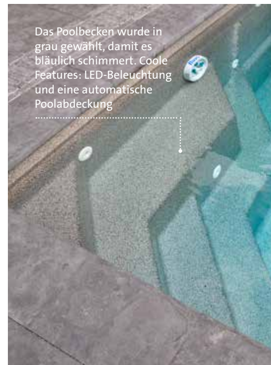
Das Poolbecken wurde in grau gewählt, damit es bläulich schimmert. Coole Features: LED-Beleuchtung und eine automatische Poolabdeckung