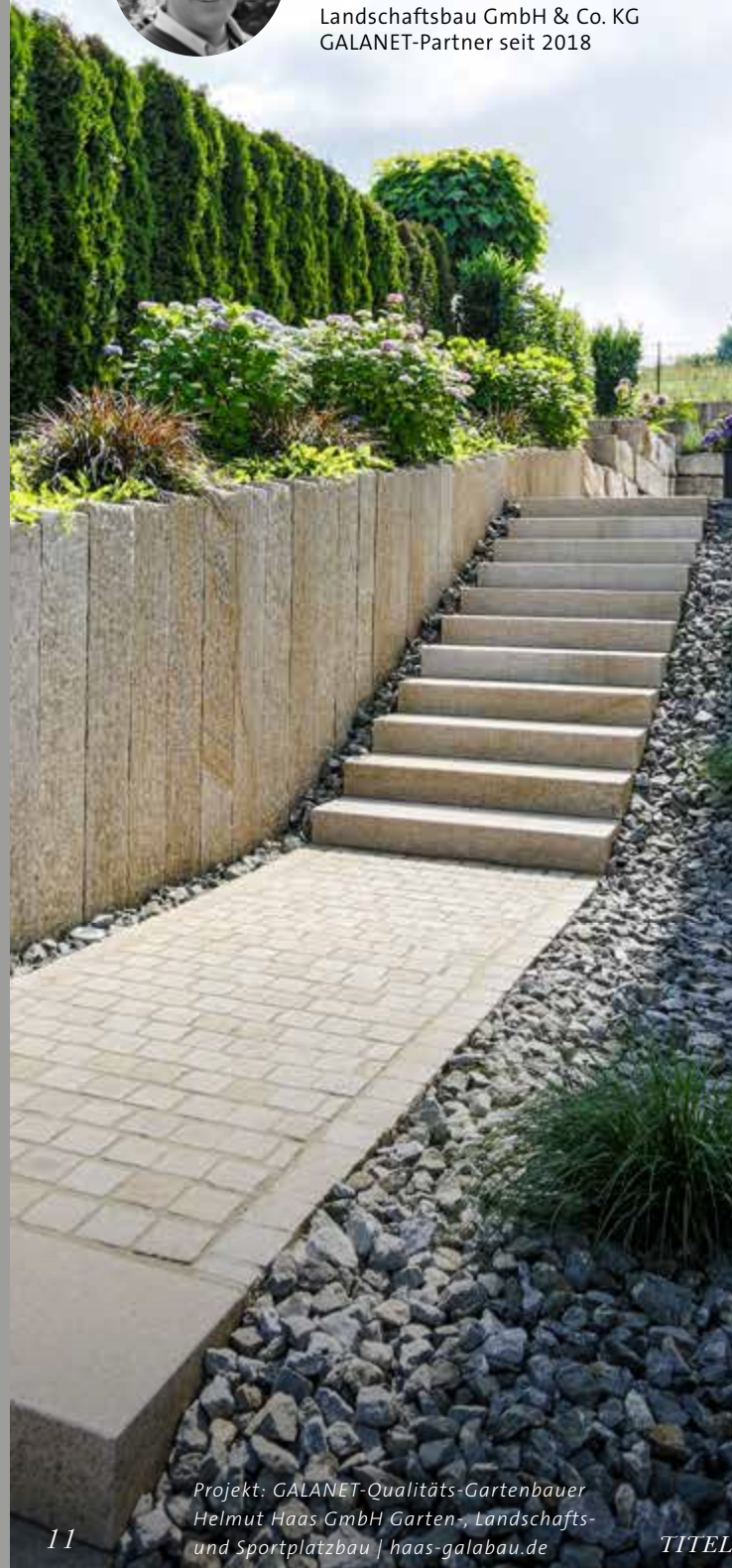
Projekt: GALANET-Qualitäts-Gartenbauer Helmut Haas GmbH Garten-, Landschafts- und Sportplatzbau | haas-galabau.de

TERWIEGE Garten- und Landschaftsbau GmbH & Co. KG GALANET-Partner seit 2018