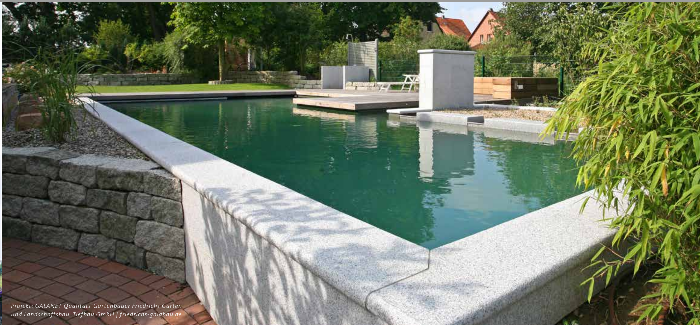
Projekt: GALANET-Qualitäts-Gartenbauer Friedrichs Garten- und Landschaftsbau, Tiefbau GmbH | friedrichs-galabau.de